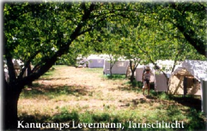
Kanucamps Levermann, Tarnschlucht