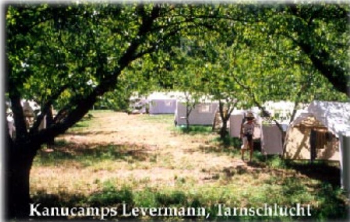
Kanucamps Levermann, Tarnschlucht